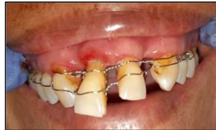
Gambar 9. Kondisi rongga mulut pasien setelah dilakukan splinting dengan wire.

Pada pertemuan berikutnya dilakukan splinting dengan wire ligature teknik essig pada gigi 15, 14, 13, 11, 21, 23, 24, dan 25. Metode ini menggunakan wire primer dengan diameter 0,3 mm dan wire sekunder dengan diameter 0,28 mm. Edukasi kepada pasien tidak untuk menggigit makanan keras. Instruksi untuk kontrol setelah 1 minggu dan 1 bulan pasca perawatan.