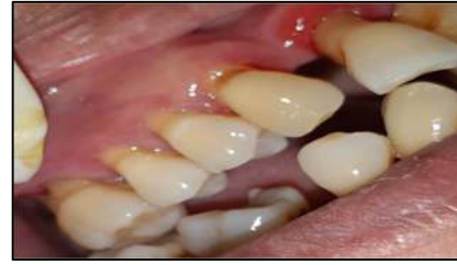
Gambar 7. Kondisi gigi posterior dextra setelah dilakukan scaling