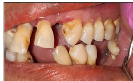
Gambar 3. Gambaran klinis pasien menunjukkan adanya kalkulus, pada gigi posterior sinistra.