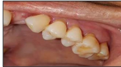
Gambar 8. Kondisi gigi posterior sinistra maksila setelah dilakukan scaling