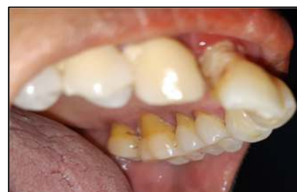
Gambar 4. Gambaran klinis pasien menunjukkan resesi gingiva pada gigi 27, 26, 25, dan 24.

Pasien dijelaskan mengenai diagnosis, rencana perawatan, komplikasi, efek samping, serta hasil perawatan dan pasien telah menyetujui. Pasien selanjutnya dilakukan pemeriksaan penunjang berupa rontgen panoramik. Berdasarkan hasil rontgen ditemukan adanya resorpsi tulang alveolar secara horizontal pada anterior rahang atas