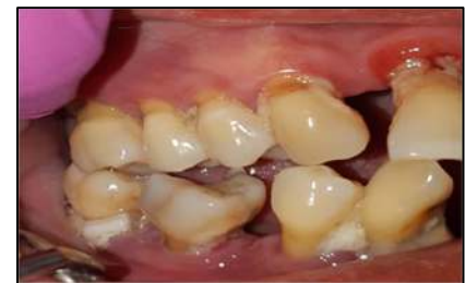
Gambar 2. Gambaran klinis pasien menunjukkan resesi gingiva pada gigi posterior dextra serta akumulasi kalkulus