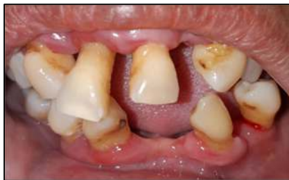
Gambar 6. Kondisi gigi anterior setelah dilakukan scaling masih terdapat resesi gingiva pada gigi 11 dan 21.

Pada pertemuan 1 minggu berikutnya dilakukan pemeriksaan gula darah sewaktu dengan hasil 199,3 mm/dL. Pemeriksaan intraoral dengan hasil OHI-S=1,75 (sedang), sudah tidak terdapat kalkulus supragingiva pada semua regio, tetapi masih terdapat pembengkakan pada margin gingiva anterior rahang atas dan kegoyangan gigi. Perawatan selanjutnya dilakukan yaitu splinting pada gigi depan atas yang mengalami kegoyangan (gambar 9-10).